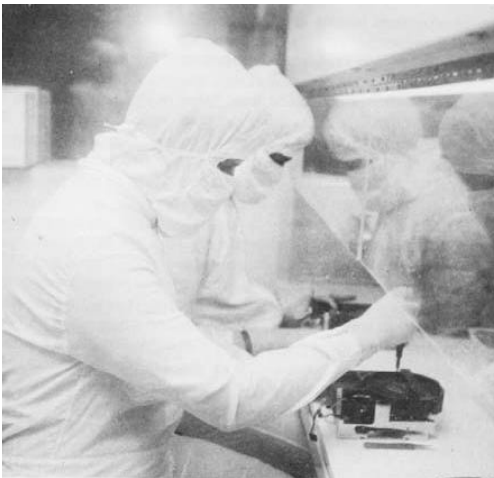
Operárias montam unidades de disco winchester na sala-limpa da Flexidisc.