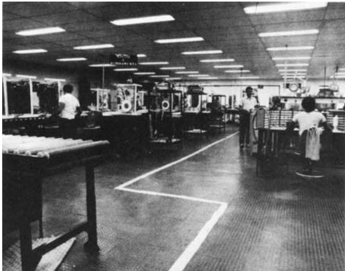
Fábrica da Compart: à esquerda, a linha de ajustes finais; à direita, bancadas de teste e inspeção.