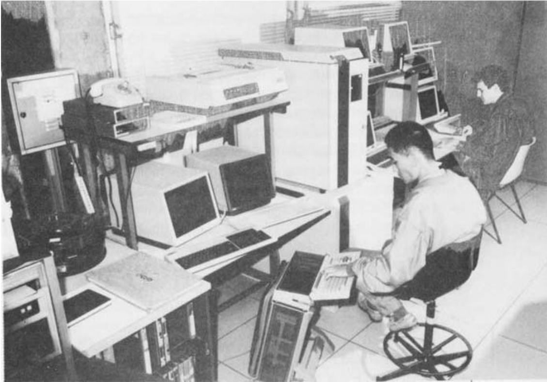
Aspecto dos laboratórios da Labo: engenheiros desenvolvem um sistema de comunicação para o supermicro Veja (visto entre as duas bancadas).