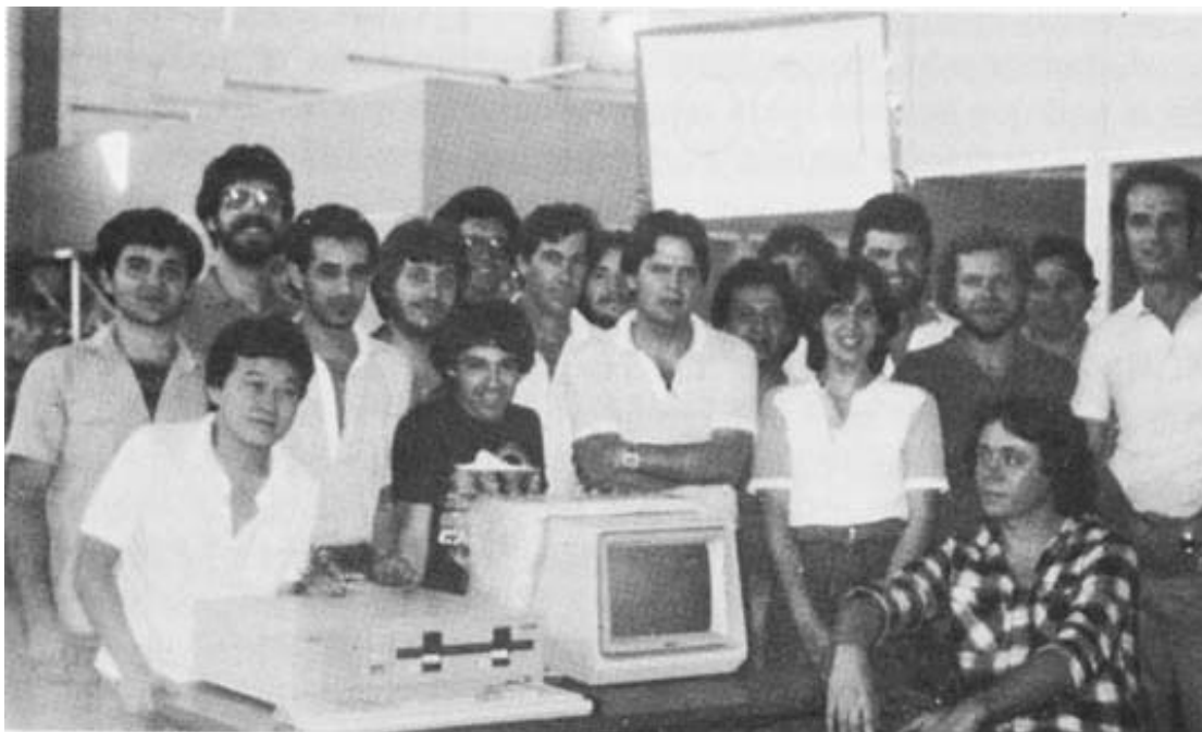
Foto histórica: o primeiro exemplar do Nexus e os engenheiros da Scopus que o fizeram.