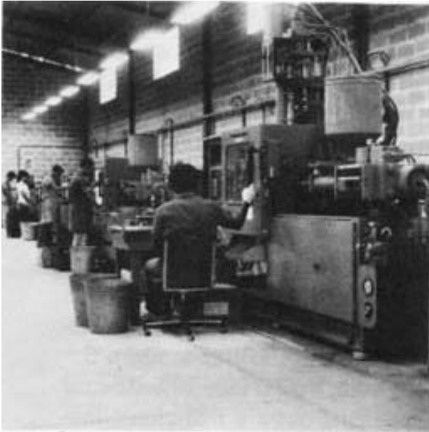
Unidade mecânica da Digiponto, fabricante de teclados.