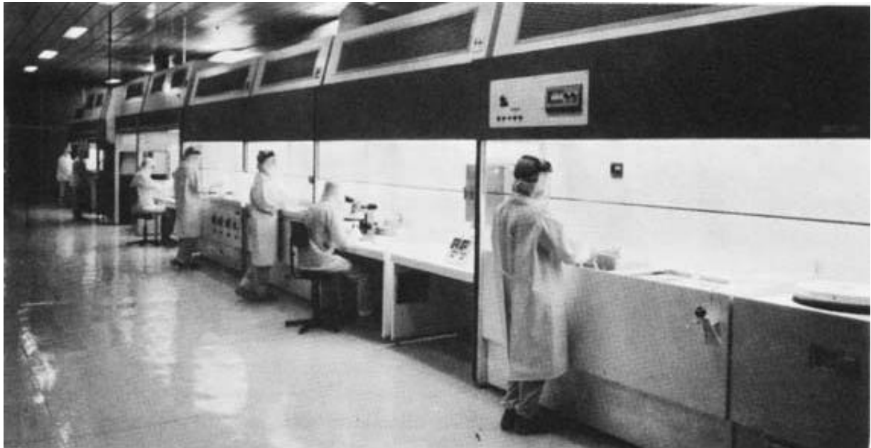
Sala-limpa de difusão das pastilhas de circuito impresso, da Sid Microeletrônica.