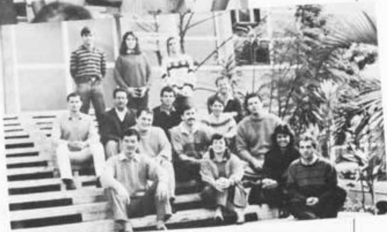
...da CPM. Mercado reservado para a jovem engenharia brasileira.

O Sox não resultou propriamente de engenharia reversa. O SVID poupou à equipe de Freire todo o trabalho de "levantar" as especificações. Seus engenheiros pegaram o atalho e ainda tiveram muito o que fazer para gerar 49 mil linhas de código-fonte (80% em C e 20% em assembler do Motorola 68000), compiladores, programas auxiliares etc., que deram à Cobra – ao lado da IBM que fez o seu e da própria AT&T – o privilégio de deter o total domínio de um sistema do tipo Unix. Pode comercializá-lo à vontade no Brasil e no exterior. Outras empresas brasileiras já o licenciaram: a Itautec, a Scopus, a Labo, a EBC. Recentemente, a Associação Brasileira da Indústria de Computadores e Periféricos (Abicomp) decidiu formar