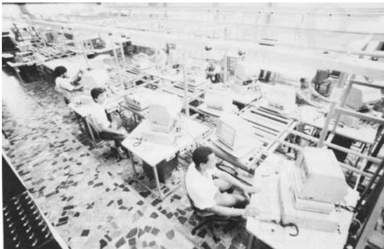
Unidade de integração de Mutinga II (Scopus): notar os microcomputadores com os quais os operários testam os equipamentos recém-montados.