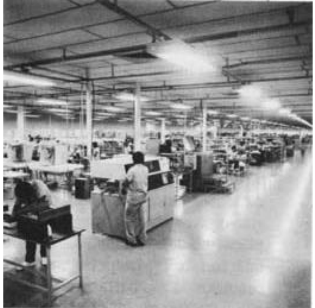
Visão geral da fábrica de impressoras de grande porte, da Digilab.