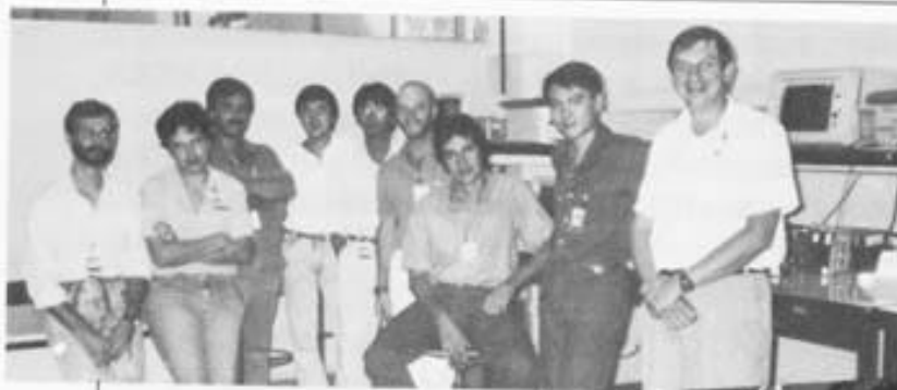
Equipes de desenvolvimento: da Microtec...