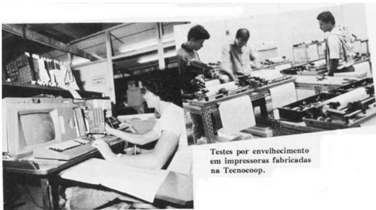
Testes por envelhecimento em impressoras fabricadas na Tecnocoop.