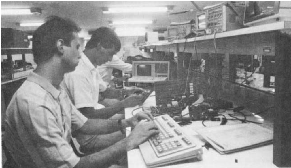
Laboratório de projeto de máquinas da Itaotec: no computador mas, também, à mão, o atento trabalho de desenvolvimento.

A capacitação tecnológica começa na formação de técnicos de nível superior. Nas universidades e nos centros de pesquisa se adquirem os conhecimentos básicos que as empresas utilizarão no desenvolvimento de seus produtos e seus processos. Ali se absorve a teoria. Várias são as empresas nacionais nascidas diretamente dos conhecimentos universitários.