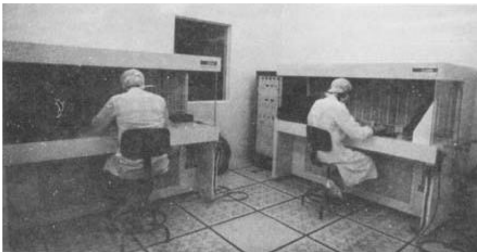
Visão parcial da sala-limpa da Microlab, a maior da América Latina, com 250 metros quadrados.

Ela se queixa - e muito - é dos concorrentes que oferecem ao mercado soluções inteiramente independentes. Foi o que a Digirede aprendeu ao comercializar o Transax , um novo sistema operacional de 1,5Mb que começou a desenvolver em 1984, consumindo, nestes quatro anos, US$ 13 milhões e o trabalho de 120 engenheiros. Baseado no conceito de processamento em transações, garante melhor desempenho no teleprocessamento, diminui em muito os riscos de queda do sistema e requer menos investimentos na instalação das redes. Em termos práticos, elimina a necessidade de aquisição dos custosos grandes computadores e de suas controladoras de comunicação, o cerne dos negócios da IBM. "A gente propôs outro padrão padrão", afirma Arnon Schreiber. E, por isto, não demorou a chegar aos seus ouvidos o que os vendedores da IBM vinham dizendo aos clientes sobre os "riscos" de adotar o sistema da Digirede.